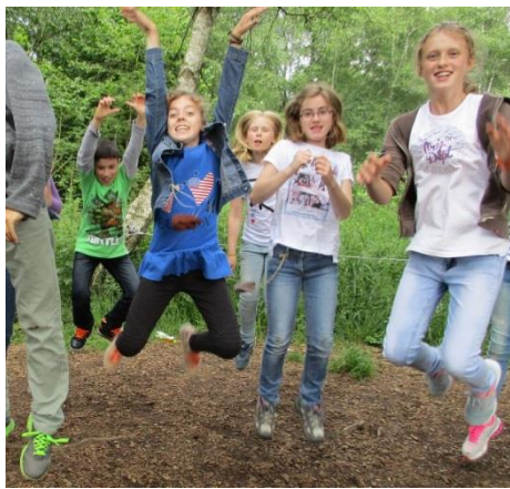
... betrachten die „Wackelwaldspringmäuse“.