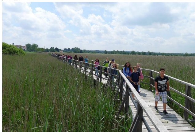
Auf dem Steg zum Federsee.

„Zurück in die Steinzeit“, ein leider oft negativ besetzter Aphorismus für Rückschrittlichkeit, erfuhr während der beiden unterschiedlichen museumspädagogischen Angebote, der Lederbeutelherstellung sowie der Töpferei, nebst der etwa eineinhalbstündigen Führung durch das Museumsgelände eine positive Bedeutung. Die Schülerinnen und Schüler erhielten einen vertieften, regionalgeschichtlichen Einblick in Lebens- und Wirtschaftsformen der Alt- und Jungsteinzeit am Federsee. Aufgeteilt in zwei Neigungsgruppen, lernten sie sowohl die Jagd- und Lebensgewohnheiten der altsteinzeitlichen Jäger und Sammler vor ca. 16000 Jahren als auch die neolithischen Dörfer im Moor, samt ihrer einstigen Bewohner der Jahre zwischen 4400 und 2700 v. Chr., anhand von Exponaten und Repliken kennen. Töpferwaren der Schussenrieder Kultur (4200 – 3700 v. Chr.) dienten als Steilvorlage für eigene Kreationen, die momentan trocken und des Brennvorhanges harren. Die Zerreißprobe steht noch an. Wie zeitintensiv und mühevoll es einst war, einen gebrauchsfähigen Topf, ohne Töpferscheibe, in „Wulsttechnik“, zu töpfern, wurde so manchem klar. Ferner wurde der ureigene Jagdinstinkt der Sechstklässlerinnen und Sechstklässler geweckt, was deren leidenschaftlichen Umgang mit Nachbildungen altsteinzeitlicher Speerschleudern bewies. Auch die Begleitlehrkräfte folgten tatkräftig diesem Urinstinkt.