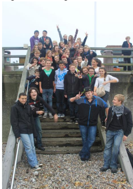
Deutsche und Franzosen an der Küste in Etretât