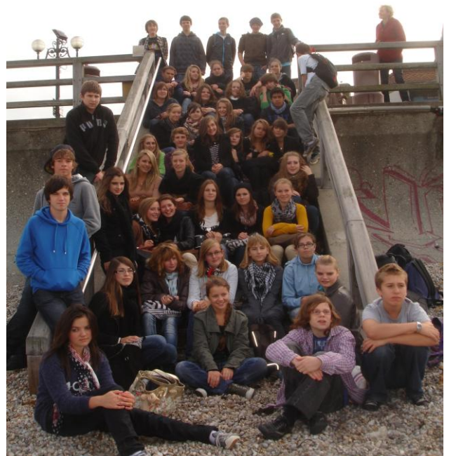
Deutsche und französische Schüler an der Küste