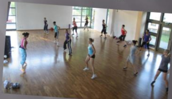
Fußball- und Sportverein Dautmergen www.fsv-dautmergen.de info@fsv-dautmergen.de

Die Kosten für den Kurs: Nichtmitglieder 40,- EUR / Mitglieder 35,- EUR