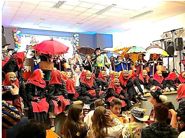
Foto: Die Narrenzunft aus Böhlingen sorgte beim Publikum für Gänsehautmomente. Sie nahmen die letzten Jahre nur an Fasnetsumzügen teil und besuchten erstmals nach zehn Jahren wieder einen Brauchtumsabend. Die Bühne platzte schier aus allen Nähten.

on - ganz nach dem Motto „Jedem zur Freud und niemand zum Leid“ an erster Stelle stand.