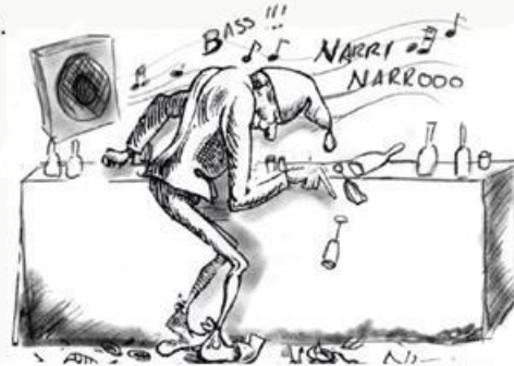
Und Heim ganga duat ma erst dann, wenn ma wirklich nemme kann!