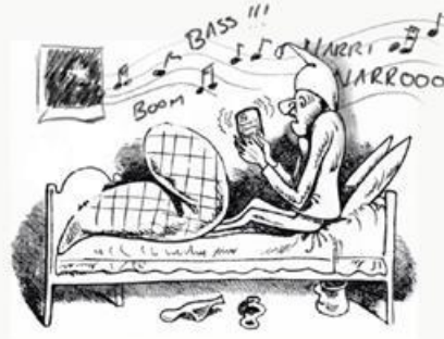
Uff d' Fasnet goht ma, ist doch klar!!!