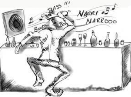
Zum Azicha brauchst dies Jahr nischt, komm ge Danza, wie da ins Bett ganga bischt :)