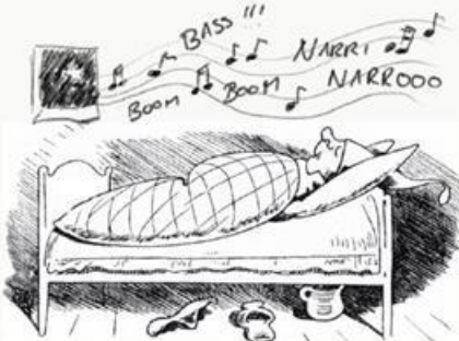
Schlafen kannst du s' ganze Jahr.