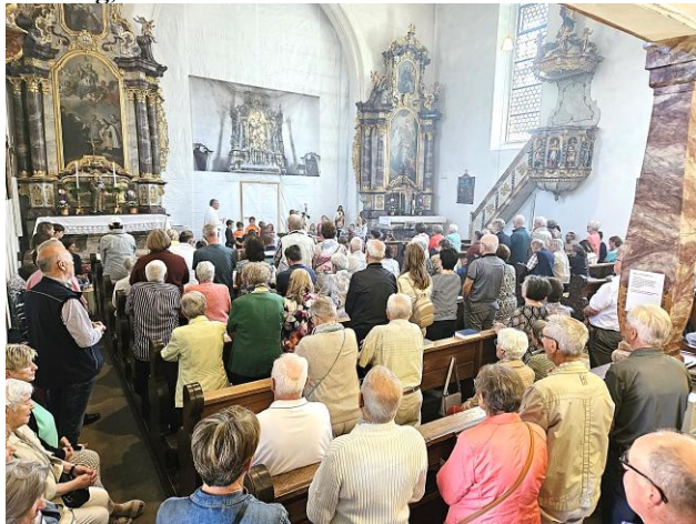
Foto: volles Gotteshaus – die Wallfahrtskirche auf dem Palmbühl in Schömberg.

Wer am Sonntag, den 14. Juni 2026 den Weg zur Wallfahrtskirche auf dem Palmbühl in Schömberg fand, merkte schnell: Hier ging es nicht nur um ein Fest, sondern um ein echtes Gemeinschaftserlebnis. Unter dem Motto „Trau dich zu GLAUBEN“ feierte die Seelsorgeeinheit Oberes Schlichemtal, bestehend aus neun Gemeinden, ihren großen Tag. Der Mut zum Glaube, die Gemeinschaft und Lebensfreude standen hierbei ganz im Mittelpunkt.