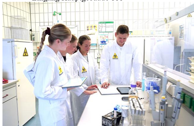
In den Pfingstferien veranstaltet die Fakultät Life Sciences einen Studieninformationstag.

Wo: Campus Sigmaringen, Anton-Günther-Str. 51, Eingang Hauptgebäude 600