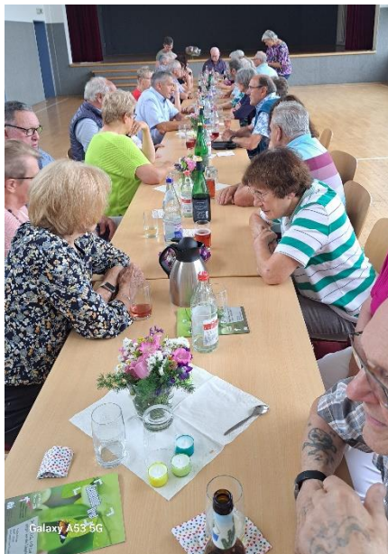
Bild 1 Teilnehmer am Seniorengrillfest