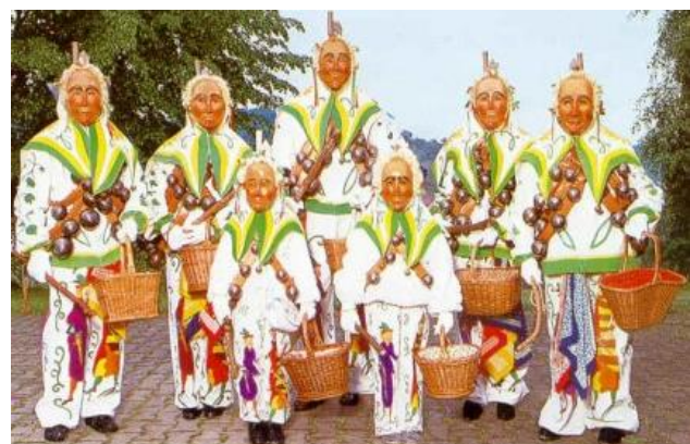
HAU - DRUFF