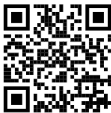
QR-Code Infoseite Anmeldung RS Schömberg

Das Anmeldeformular sowie alle detailliertere Informationen und Hinweise zur Anmeldung finden die Eltern auf unserer Homepage unter „Informationen“ – „Anmeldung“. Direkt dorthin gelangt man mit dem nachfolgenden QR-Code.