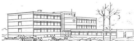
Realschule und Werkrealschule Schömberg