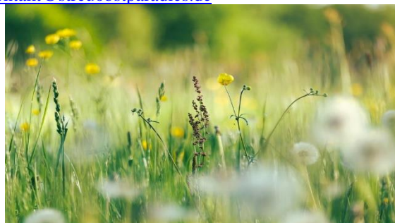
Achtsamkeit in der Streuobstwiese

Diese und viele andere tolle Angebote finden Sie in unserer Broschüre „Obstwerkstatt im Streuobstinfozentrum“. Ganz einfach bestellen unter: kontakt@streuobstparadies.de