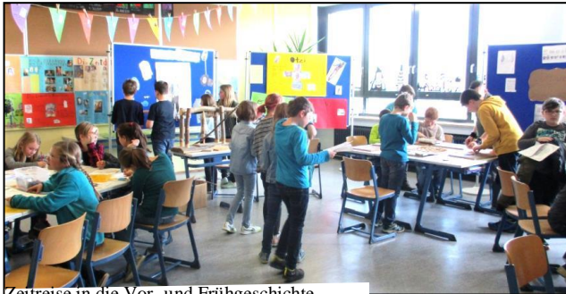
Zeitreise in die Vor- und Frühgeschichte