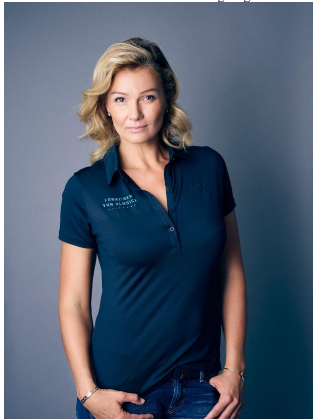
Franziska van Almsick Stiftung