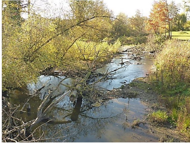
Foto: Gelungene Renaturierung: Die alte Kinzig bei Willstätt im Ortenaukreis/ Schneider-Ritter/ RPF

Den Link zur Online-Beteiligung sowie eine Anleitung finden Sie unter „Aktuelles“ auf der Internetseite des RP: www.rp-freiburg.de