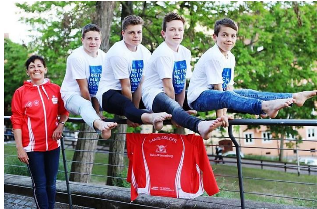
Bildanhang: Stolz präsentierten sich die Turner in Nürnberg.