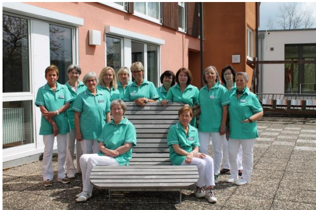
Die Grünen Damen in Tieringen bei ihrem ersten Treffen in diesem Jahr.

Die pandemische Entwicklung im Zollernalbkreis wird weiterhin beobachtet. Bei gesetzlichen Verordnungen können Regelungen wiedereingeführt werden.