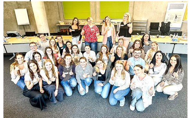
Fit für den Rentenblicker: Die neu ausgebildeten Referentinnen und Referenten der DRV BW in Stuttgart.

Die DRV BW hat nach der Corona-Pause die Ausbildung ihrer Mitarbeitenden hierzu neu konzipiert und so viele Personen wie noch nie dafür qualifiziert. Neben der Schulung auf die Rentenblicker-Unterrichtsmaterialien beinhaltet die Ausbildung auch Themen wie Rhetorik, Didaktik oder den Unterrichtsaufbau. Alle Referentinnen und Referenten haben zuvor eine DRV-spezifische Ausbildung oder ein entsprechendes duales Studium durchlaufen.