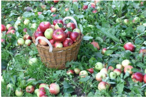
Über 2.000 verschiedene Obstsorten gibt es auf den schwäbischen Streuobstwiesen. Einen ersten Einstieg in das weite Feld der Pomologie liefern die Seminare des Vereins Schwäbisches Streuobstparadies.

Anmeldungen nimmt die Geschäftsstelle des Schwäbischen Streuobstparadieses per Mail unter kontakt@streuobst-paradies.de entgegen. Die Ausschreibung zu den Seminaren sowie weitere Infos sind auch auf der Internetseite www.streuobstparadies.de zu finden.