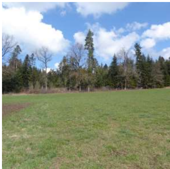
Abbildung 2: Bestandaufnahme Plangebiet