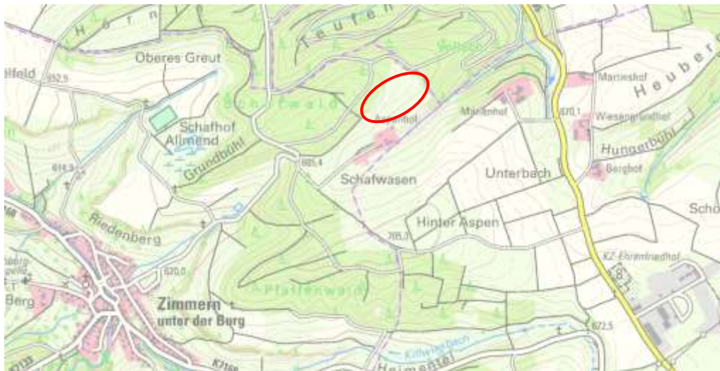
Abbildung 3: Übersichtslageplan, unmaßstäblich (Plangebiet = rot)

In der nachfolgenden Abbildung ist die Lage des Plangebietes dargestellt.