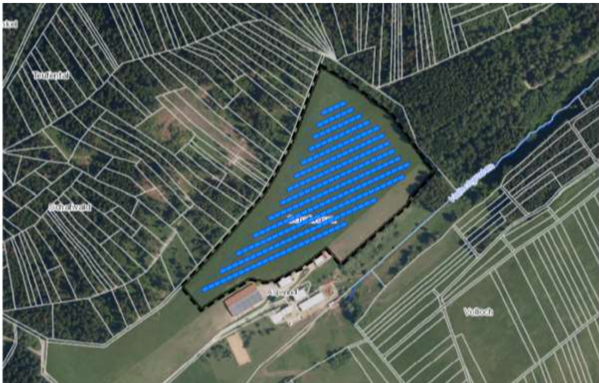
Abbildung 1: Räumlicher Geltungsbereich des Bebauungsplans „Anlage zur Nutzung erneuerbarer Energien auf Fläche für die Landwirtschaft“

In der folgenden Abbildung ist der Geltungsbereich des Bebauungsplanes mit ca. 6,3 ha des Flurstücks 1686/3 Gemarkung Zimmern udB dargestellt.