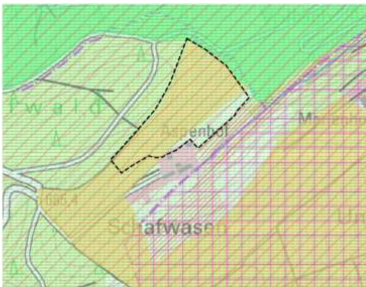
Abbildung 4: Ausschnitt aus dem Regionalplan Neckar-Alb 2013, unmaßstäblich

Im Folgenden ist ein Auszug aus dem Regionalplan Neckar-Alb 2013 dargestellt.