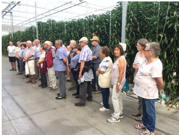
Text von: Gerhard Effinger

Die Fahrt ging dann zum Höhengasthaus „Haldenhof“, wo das Mittagessen eingenommen wurde. Den Nachmittag konnten die Ausflügler dann an der Überlinger Strandpromenade oder im Stadtpark selbst gestalten. Der Abschluss dieses schönen Ausfluges fand im Gasthaus „Grottental“ in Oberdisgisheim statt, wo ein reichhaltiges Buffet angeboten wurde. Auf der Heimfahrt bedankte sich Organisator Gerhard Effinger beim Busfahrer Norbert Schwarz. Norbert Schwarz bedankte sich ebenfalls im Namen aller bei Gerhard Effinger für die gute Organisation dieses schönen Ausfluges.