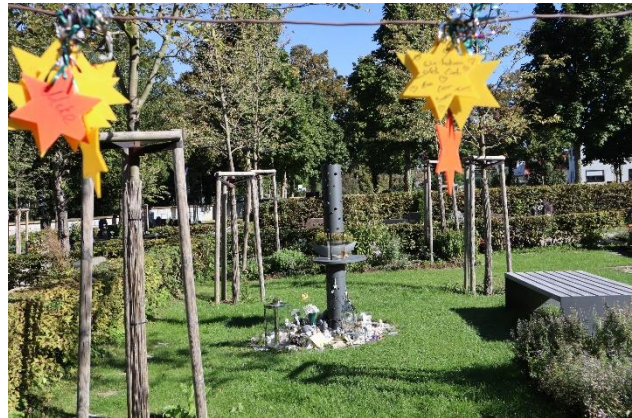
Sternengrabfeld auf dem Balinger Friedhof |

gefördert durch die Sparkasse Zollernalb