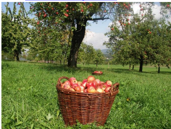
Bild: Apfelernte

Schwäbisches Streuobstparadies e.V., Bismarckstraße 21, 72574 Bad Urach, e-mail: kontakt@streuobstparadies.de