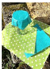
Bienenwachstücher selber herstellen – ist nur eines von zahlreichen Angeboten in der Obstwerkstatt des Streuobst-Infozentrums in Mössingen