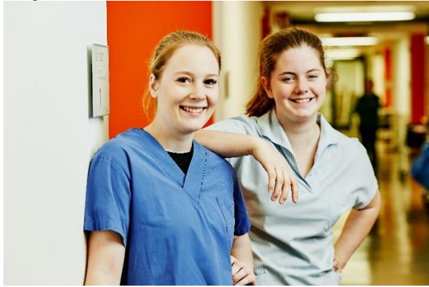
Auszubildende zur Pflegefachfrau im Zollernalb Klinikum

Weitere Infos unter www.zollernalb-klinikum.de , Bewerbungen bitte an kariere@zollernalb-klinikum.de